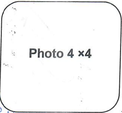
Photo 4 x4